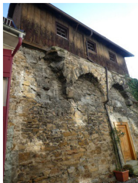
Stadtmauer mit angebauten Stadtmauerhäusern 18. Jh.

... dann kehren wir zurück in die Gegenwart und können noch viele Sehenswürdigkeiten früherer Zeiten bestaunen.