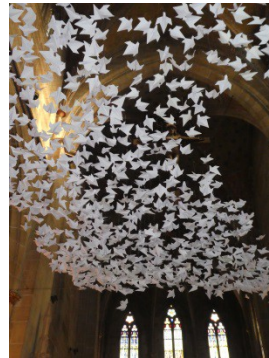
1000 aus Papier gefaltete Friedenstauben