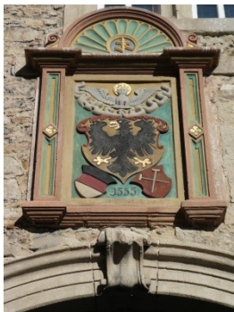
Spitalhof-Wappen 13. Jh.